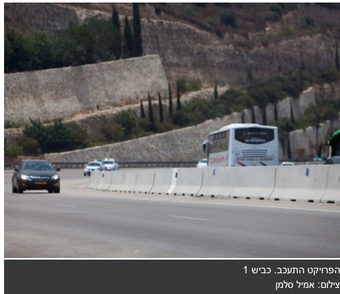
הפרוייקט התעכב. כביש 1

לטענת בעלי החברה, היא נקלעה לקשיים בעקבות לוח התשלומים בפרוייקטים של המדינה, שהשתנה עקב שיטת "אבני דרך" שאלה עברה המדינה: בעוד שבעבר קבלנים היו מקבלים את התמורה על עבודתם בהתאם להתקדמות בעבודה, בשיטת "אבני דרך" הקבלן מקבל את התמורה רק כשהגיע לשלבים מסוימים בפרוייקט.