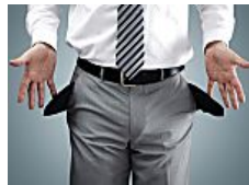
פשיטת רגל לפי הוראות הפקודה אל מול תיקון 47 – "חוק השמיטה" – הפטר כלכליט - פרויקטים