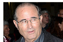
גוש בלס בפעולה ראש המוסד לשעבר, שרתי שביט, יחפש מעלמי' מס פייסבוק