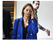
העניבה הבווערת של הגנב במאה ה-21