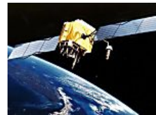
אפקטיב ספייס מהרצליה ימכור לוויינים ב-70 מיליון דולר